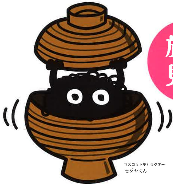
マスコットキャラクター モジャくん